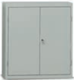
E916 - E926 - E921

■ RAL 7038 Gehäuse ■ RAL 7038 Schubladen