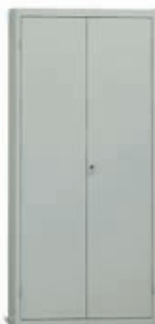
E908 - E913