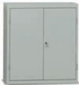
E923 - E928