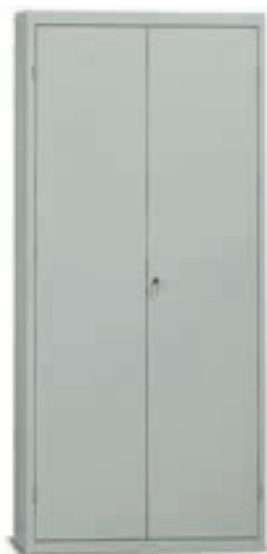
E222 - E236